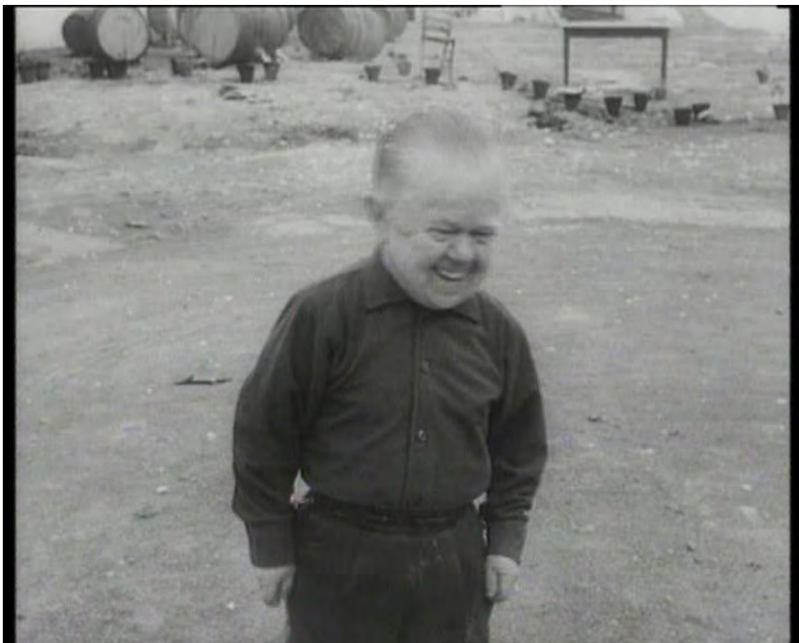
Fotografía II. ¿La risa como alegría o la risa como angustia?