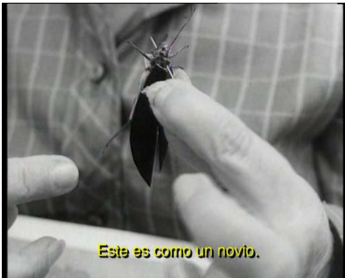
Fotografía IV. Un novio con alas de libertad. Libertad cercenada por el metal.