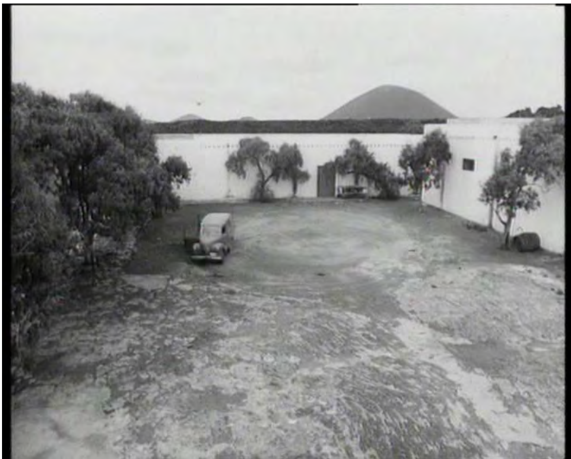
Fotografía VI. Frente al círculo que describe el coche, la ortogonal arquitectura insular.