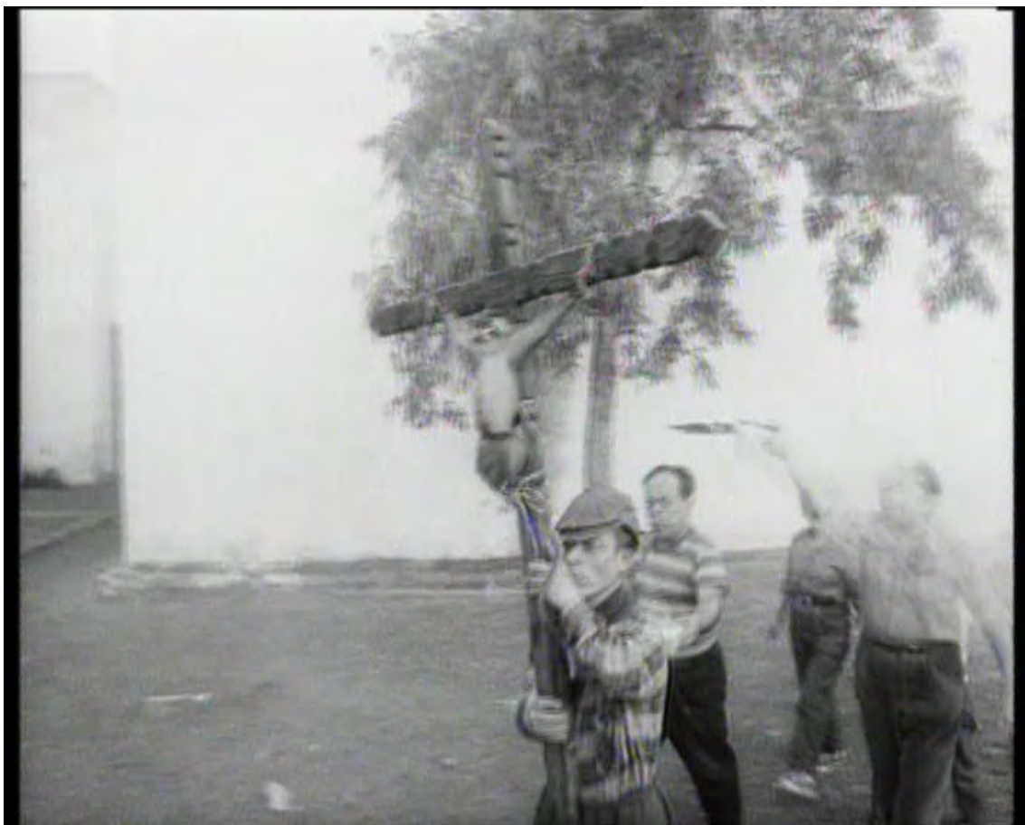
Fotografía VIII. La imagen del mono crucificado no está exenta de crueldad, como la Pasión de Cristo.