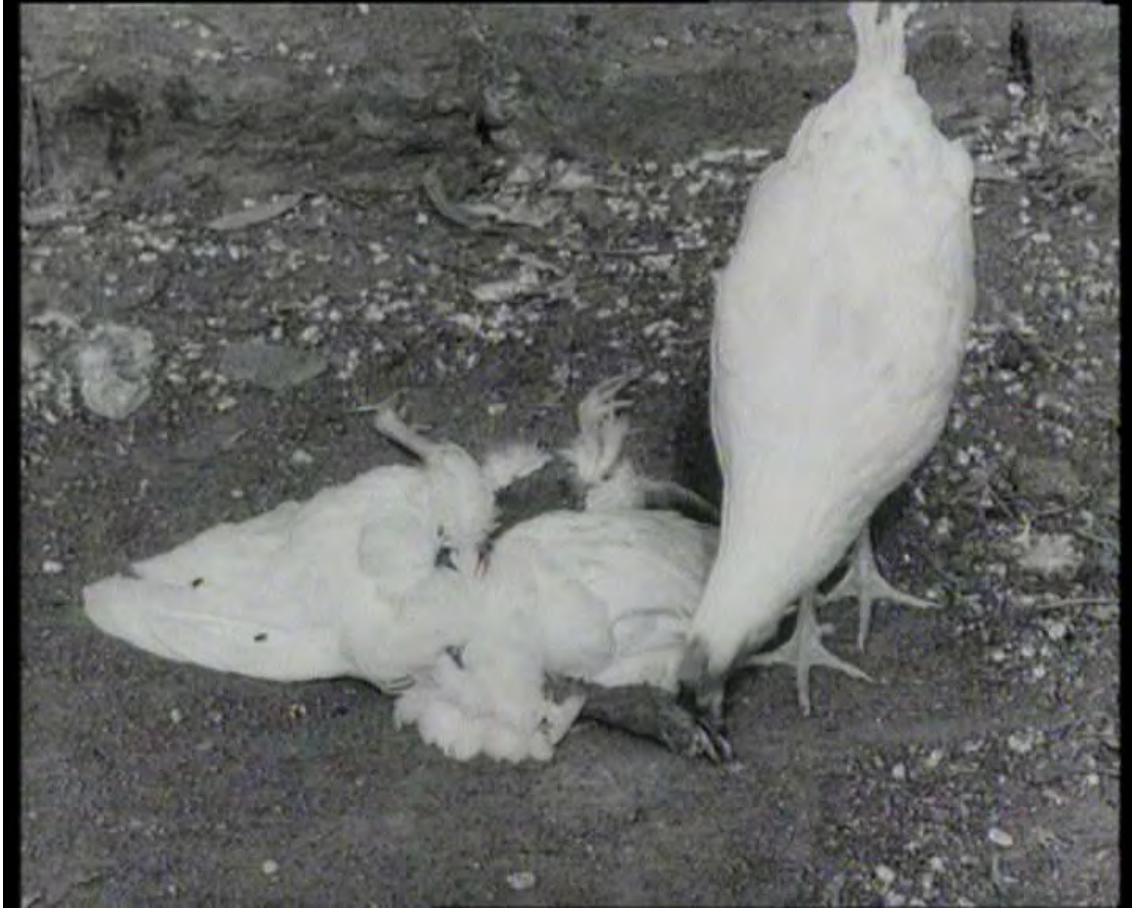
Fotografía VII. La gallina, de protectora y maternal, pasa a destructora.