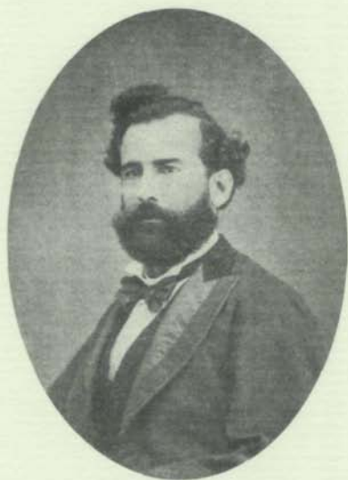
MIGUEL PEREYRA DE ARMAS

(Arrecife de Lanzarote 1841-Santa Cruz de Tenerife 1908)