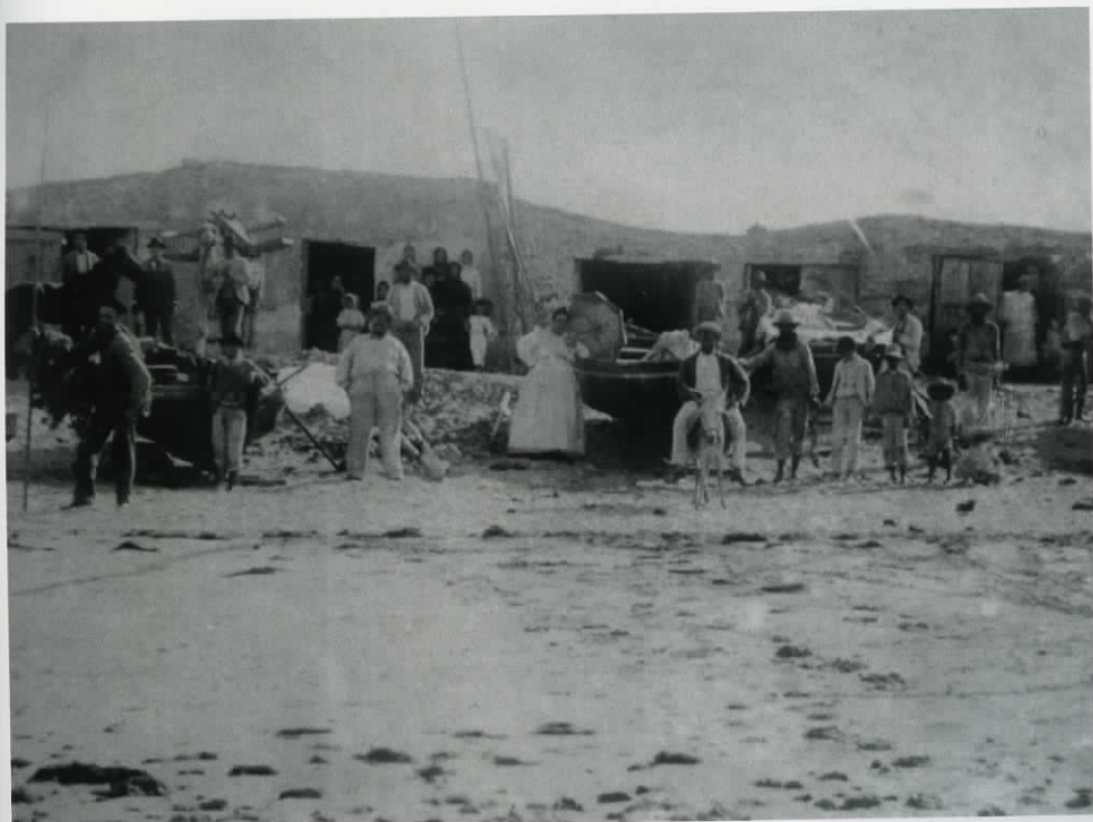
*Caleta de Famara. 1925